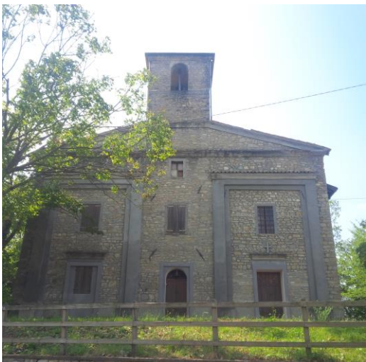
Chiesa di Piagnolo

Il percorso prevede soste con descrizioni storiche e culturali dell'interessantissimo contesto ambientale dell'area di Piagnolo, valle del Tassobio.